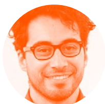
CLAUDIO BUSTAMANTE Agencia de Sustentabilidad y Cambio Climático

“Me queda un espacio ante la posibilidad de 4 personas naturales, que por ejemplo, no tienen experiencia previa [de trabajo conjunto], eventualmente puede ser un riesgo”.