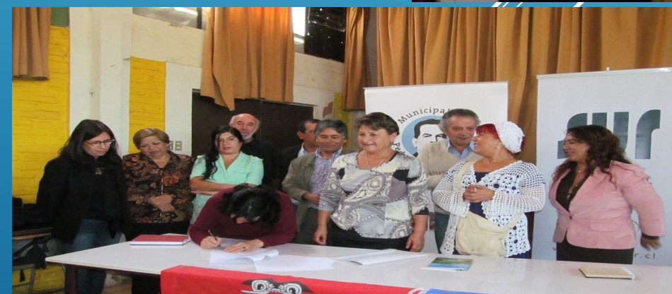
Firma de Convenio SELVIHP / PAC, 18 abril 2013